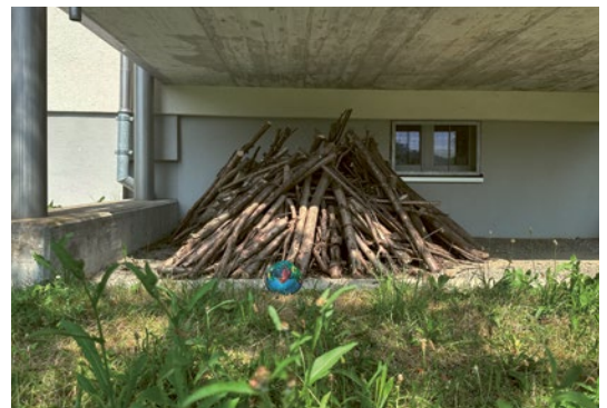
DER ASTHAUFEN dient als Unterschlupf für Igel und Vögel.