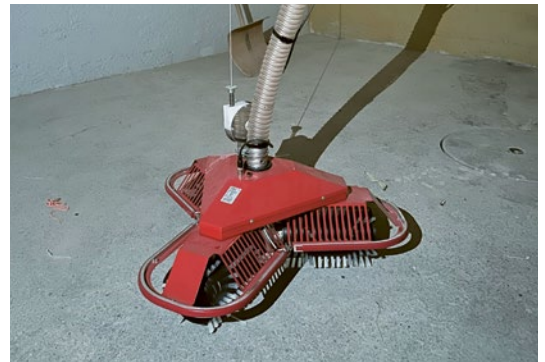
DER «MAULWURF» wühlt sich durch die Pellets, saugt sie auf und führt sie der Verbrennung zu.

die thermische Solaranlage an der Frauenfelderstrasse, sollen möglichst in die neue Heizung integriert werden. In den Häusern Burgstrasse/Eichenweg ist eine Pelletsheizung, kombiniert mit Solarwärme und Wärmespeicher, die optimale Wahl. Die Infografik zeigt, wie die verschiedenen Systemkomponenten zusammenspielen. ↪