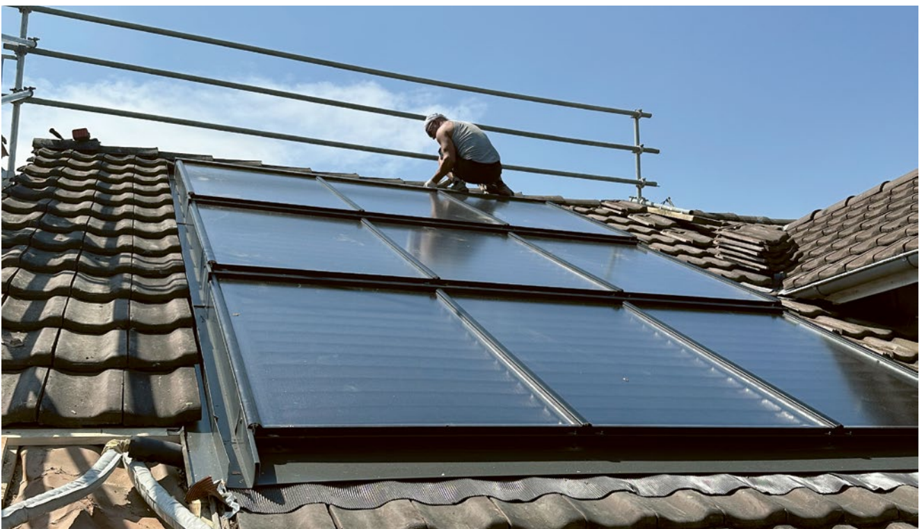
MONTAGE DER THERMISCHEN SOLARANLAGE auf dem Dach an der Burgstrasse.