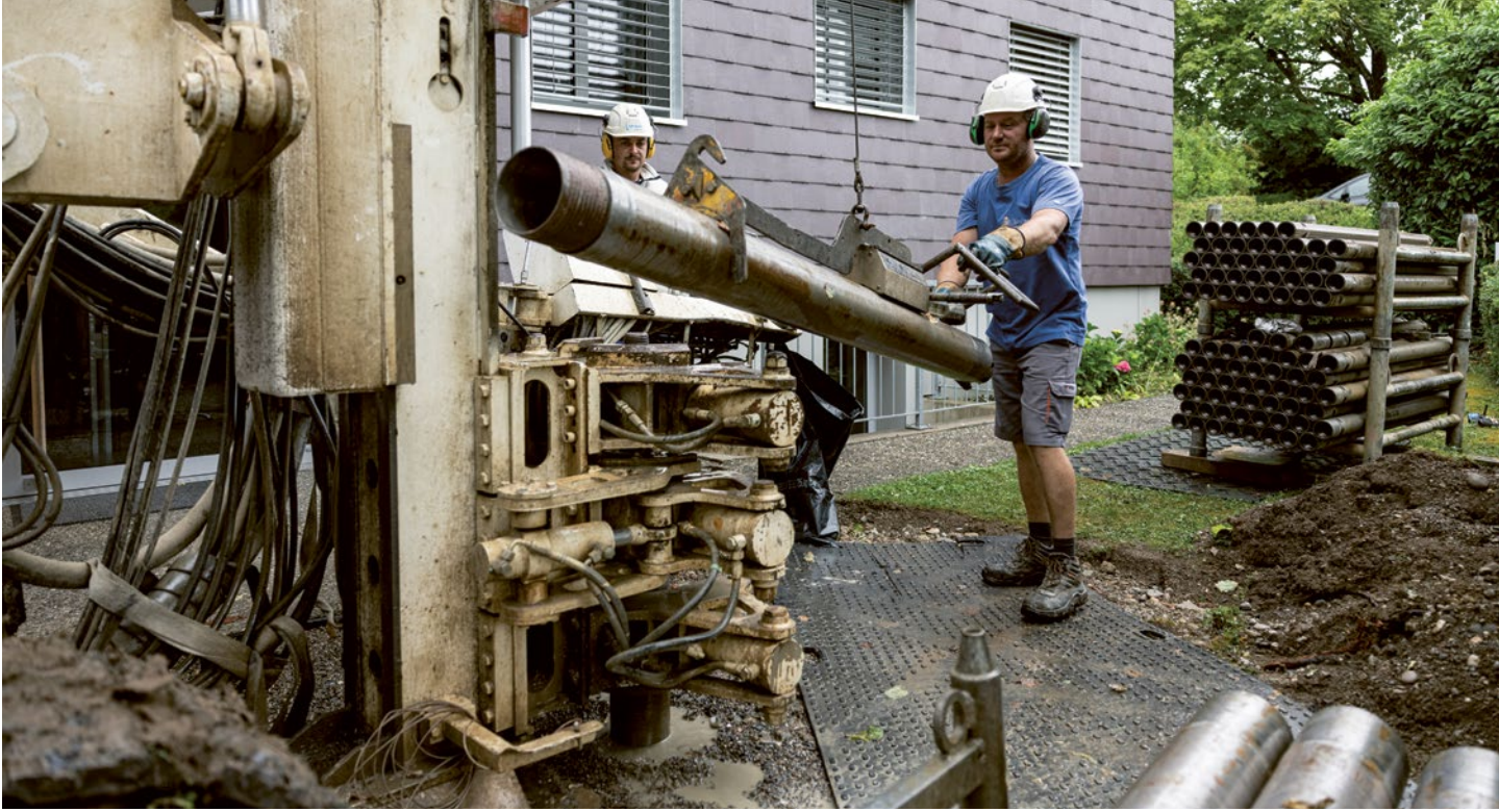
BOHRUNG VON ACHT JE 230 METER TIEFEN LÖCHERN für die Erdsonden an der Schottikerstrasse.