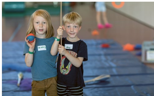
GESPANNT der nächsten GV entgegenschauen.

Die nächste GV findet am 24. Mai 2024 statt. Tragen Sie sich den Termin bereits jetzt in die Agenda ein. Die entsprechenden Unterlagen und die Einladung erhalten Sie im April 2024. 🐛