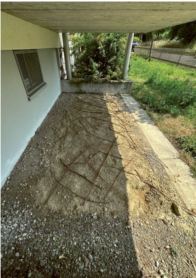
DIE ETWA 40 ZENTIMETER TIEFE SANDLINSE ist beliebt bei Wildbienen und anderen Insekten.

Ja genau. Einen Tag in der Woche schwinge ich mich aufs Velo und verteile Gemüse und Früchte. Das ist ein guter Ausgleich zur Büroarbeit. 🐣