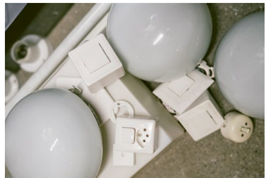
LICHTSCHALTER IN RENTE: Die Arbeit übernehmen Bewegungsmelder.

Die Leuchtdauer, die Helligkeit des Lichts und die Empfindlichkeit der Bewegungssensoren lassen sich pro LED-Leuchte per App regulieren. Das ermöglicht eine optimale Ausleuchtung. Die Lampen sind mit Bewegungssensoren ausgestattet und sie kommunizieren miteinander. Bewegt sich jemand, erkennt das die eine Leuchte und teilt es ihren Nachbarleuchten mit. Es wird hell und wieder dunkel und im Keller brennt das Licht nur noch, wenn er genutzt wird. Bewohnerinnen und Bewohner müssen nicht mehr mit den Lichtschaltern «ellenböglern», wenn sie mit den Taschen vom Grosseinkauf beladen nachhause kommen. Dank den langlebigen LED-Lampen müssen Hauswartinnen und Hauswarte weniger auf die Leiter steigen und können sich anderen Anliegen widmen. ➔